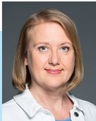
Lisa Paus Bundesministerin für Familien, Senioren, Frauen und Jugend

Spielplätze und Grünflächen, Jugendclubs und Sportvereine oder die Schule in gut erreichbarer Nähe: All das macht Städte und Gemeinden kinderfreundlich. Wer das Siegel „Kinderfreundliche Kommune“ trägt, ist in der Tat ausgezeichnet – weil dort die besonderen Interessen und Bedürfnisse von Kindern und Jugendlichen noch deutlicher im Mittelpunkt stehen. Denn diese Kommunen verpflichten sich ausdrücklich, die Kinderrechte auf lokaler Ebene zu fördern und umzusetzen..