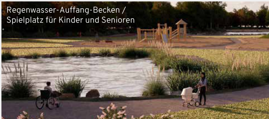
Regenwasser-Auffang-Becken / Spielplatz für Kinder und Senioren