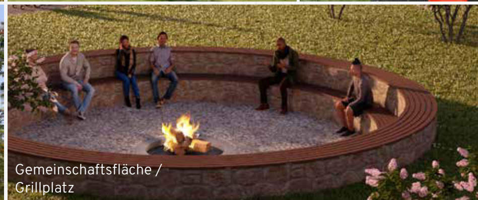
Gemeinschaftsfläche / Grillplatz