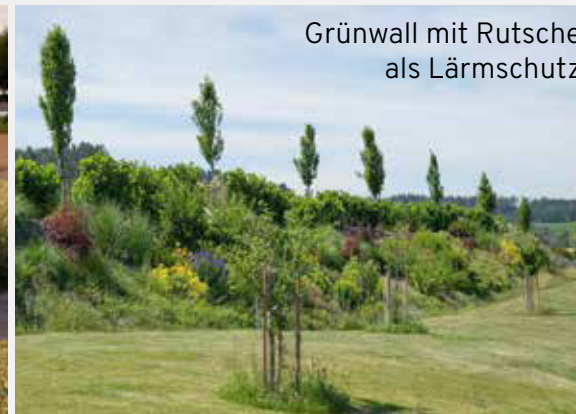
Grünwall mit Rutsche als Lärmschutz