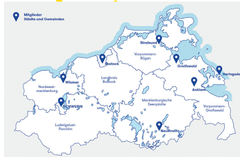
Diese Städte und Gemeinden sind Mitglied in der AGFK MV

Die hier aufgeführten Bußgelder sind zusammengefasst. Genauere Informationen und weitere Bußgelder finden Sie auf folgenden Seiten: kurzlinks.de/bussgelder-adfc kurzlinks.de/bussgelder-bmvi