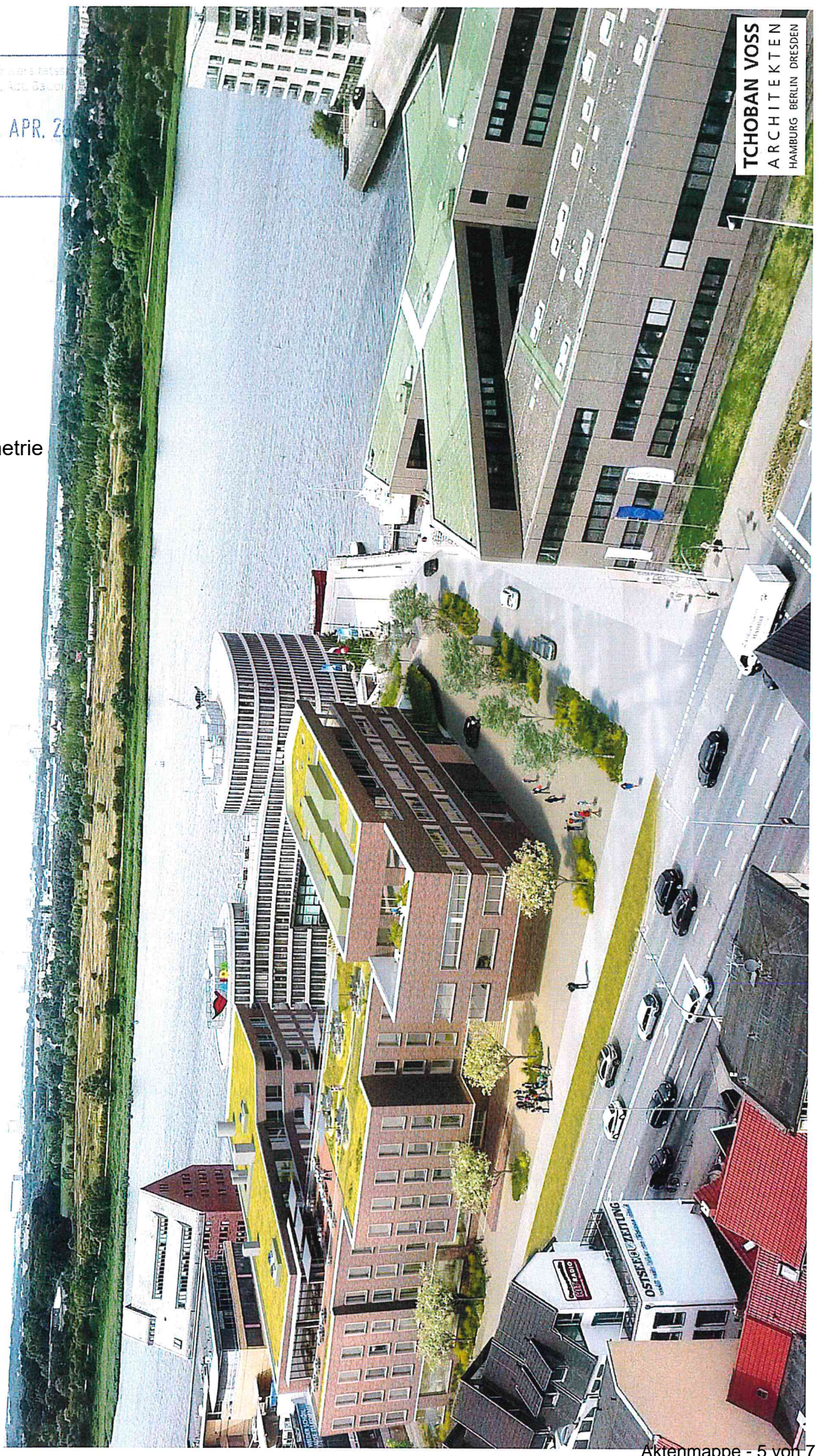
Anlage 3 Isometrie

TCHOBAN VOSS ARCHITEKTEN HAMBURG BERLIN DRESDEN