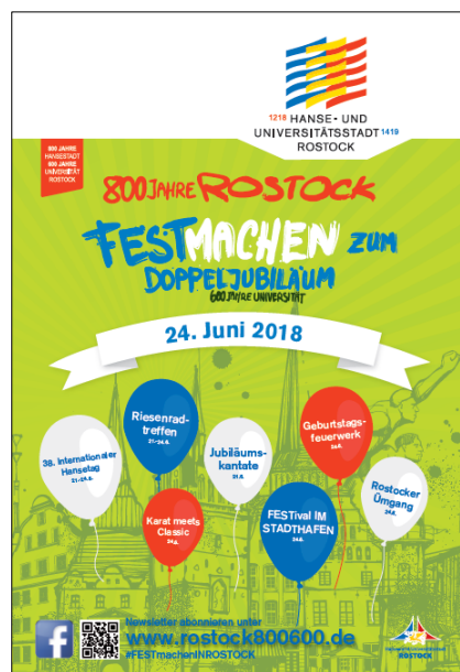
CityLight-Plakatmotiv zur Festwoche um den 24. Juni 2018

Auf dem FESTival IM STADTHAFEN feierten 14.000 Besucher am Abend des 24. Juni vor der Kulisse des Rostocker Stadthafens einen musikalischen Ausklang des 800-jährigen Stadtgeburtstags in entspannter und freudvoller Atmosphäre. Joris und Fritz Kalkbrenner begeisterten die Zuschauer und schufen einen würdigen Abschluss für die unmittelbaren Jubiläumsfeierlichkeiten und den 38. Internationalen Hansetag.