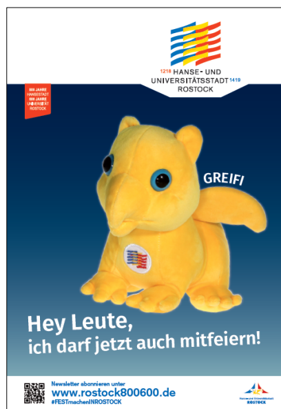
CityLight-Plakatmotiv „Greifi“ Juni 2018, weitere Greifis sind erhältlich für 800 Cent im Projektbüro

Auch der zielgerichtete Einsatz von sieben CLP-Kampagnen zu bestimmten Themen wie z. B. zum „Greifi“ war sehr hilfreich. Die Kampagne trug mit dazu bei, die zwischenzeitlichen Irritationen den „Greifi“ betreffend zu bereinigen und auf die Wiederaufnahme der Greifi-Ausgabe an alle Rostocker Neugeborenen aufmerksam zu machen.