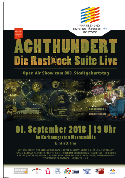
CityLight-Plakatmotiv zur Rost@ock Suite am 1. September 2018

Mit der Aufführung der Rost@ock Suite am 1. September, in der die Historie der Hanse- und Universitätsstadt künstlerisch und vor allem rockig aufgearbeitet wurde, erlebten die Besucher einen weiteren wichtigen Mosaikstein von eindrucksvollen Kunstprojekten anlässlich des Stadtjubiläums.