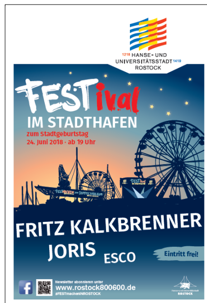
CityLight-Plakatmotiv zum FESTival IM STADTHAFEN am 24. Juni 2018

Eine große Resonanz war auch bei den in Facebook angelegten Veranstaltungen zu verzeichnen, so gab es zum FESTival IM STADTHAFEN 11.657 und für das Geburtstagsfeuerwerk 13.506 interessierte Teilnehmer.