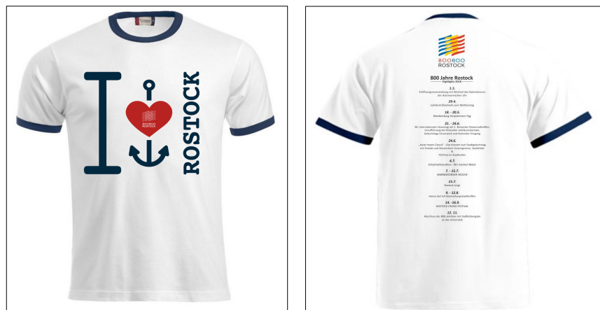
T-Shirt-Motiv „I love Rostock“ Vorder- und Rückseite, erhältlich für 800 Cent im Projektbüro

Zur Öffentlichkeitsarbeit im Rahmen des Doppeljubiläums 800/600 gehört die wohl umfangreichste Publikationstätigkeit zur Geschichte der Stadt Rostock. So entstanden rechtzeitig zum Stadtgeburtstag 40 Publikationen, darunter das „Rostock-Lexikon“, „Maritime Feste“, „Mosaik“ und die „Rostocker Filmschätze“. (Siehe Anlage 2.) 90% der Publikationen zum 800. Stadtjubiläum konnten durch die aktive Unterstützung und Förderung des Projektbüros 800/600 erfolgen. Im Projektbüro besteht die Möglichkeit, alle geförderten Publikationen zu erwerben.