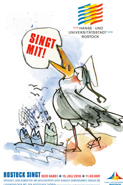
CityLight-Plakatmotiv zu „Rostock singt“ am 15. Juli 2018

Dies brachten auch sangesfreudige Rostocker, die sich am 15. Juli zum bisher größten in Rostock gebildeten Chor mit etwa 1000 Mitgliedern zusammengefunden hatten, mit der Aktion „Rostock singt“ am Warnowufer zum Ausdruck.