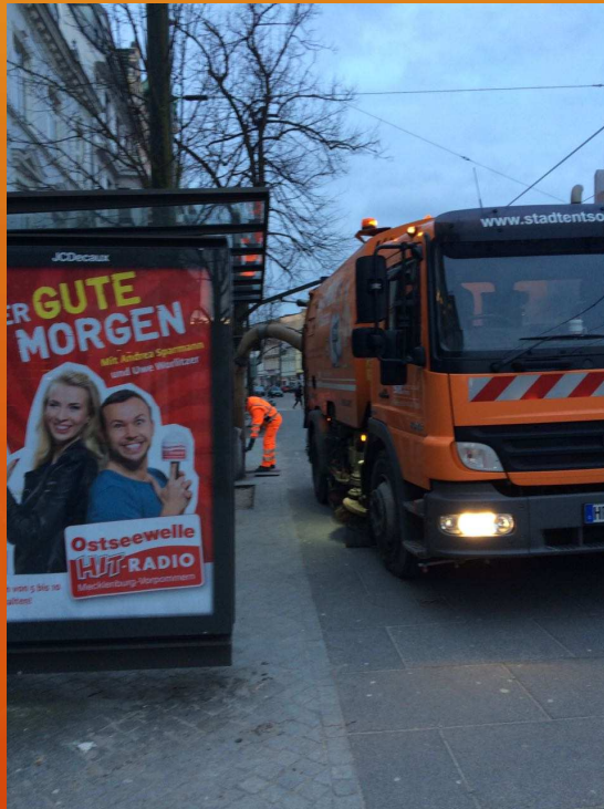
Entleerung im Haltestellenbereich