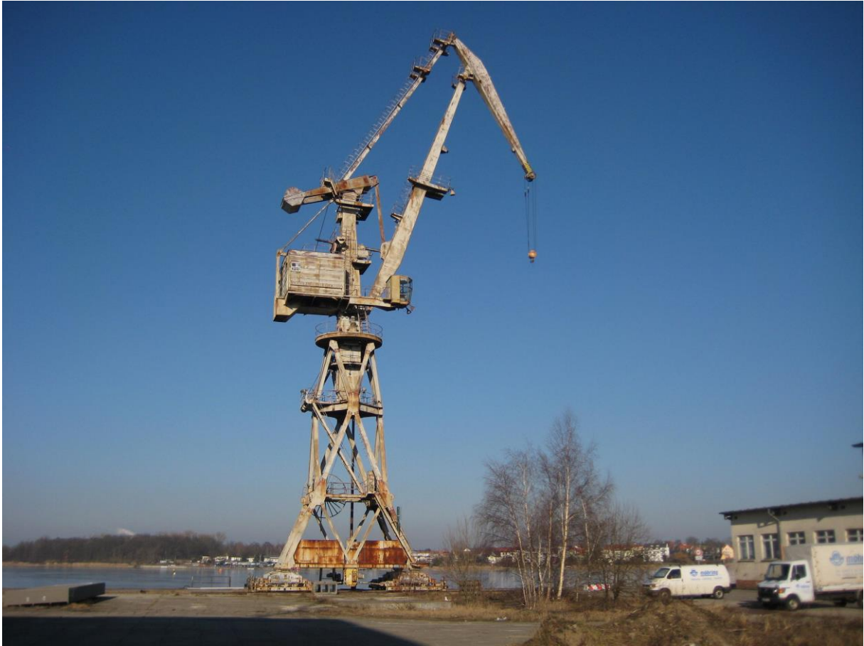
Abbildung des Portalkrans „Möwe“ vor dem Abbau