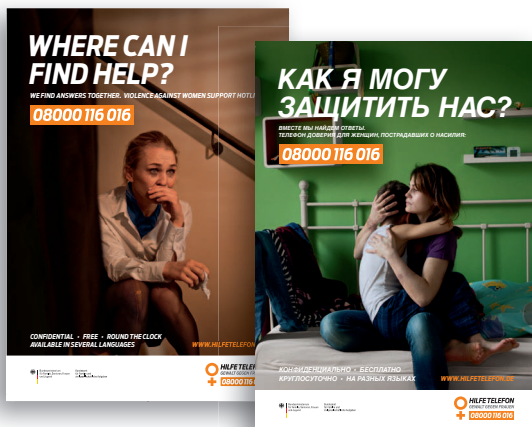
Die Kampagnenplakate sind in sechs verschiedenen Sprachen zu beziehen.