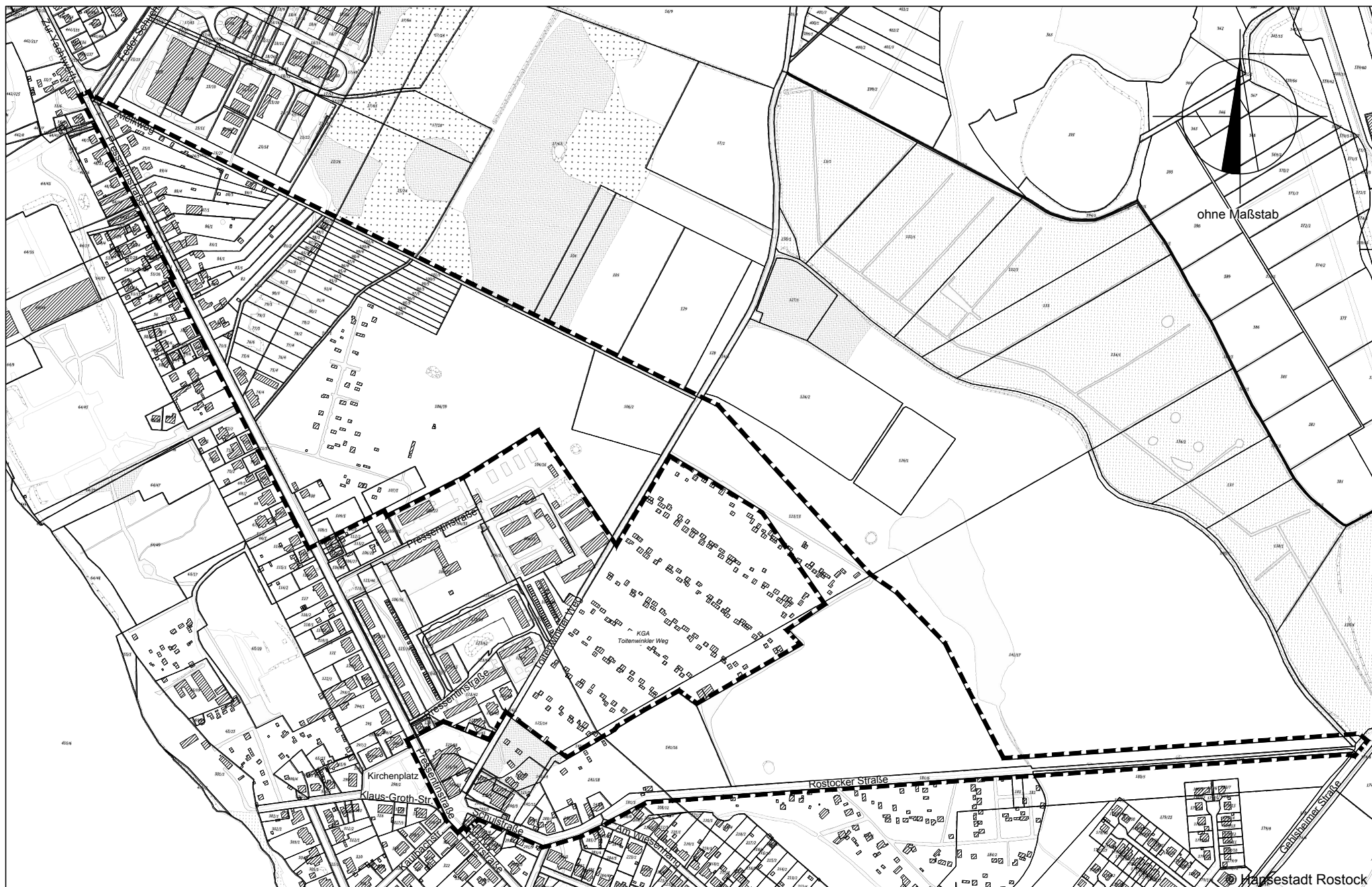
Anlage zum Beschluss über die Aufstellung des Bebauungsplans Nr. 15.W.135 "Wohngebiet Rostocker Straße / Melkweg"