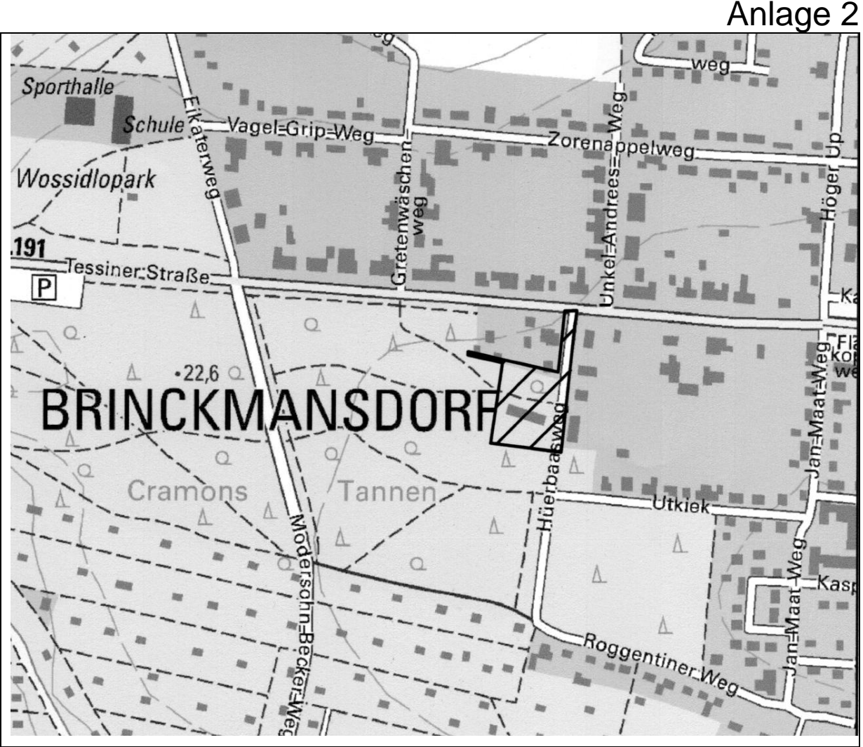
Übersichtsplan M 1: 10.000

Hansestadt Rostock Land Mecklenburg - Vorpommern