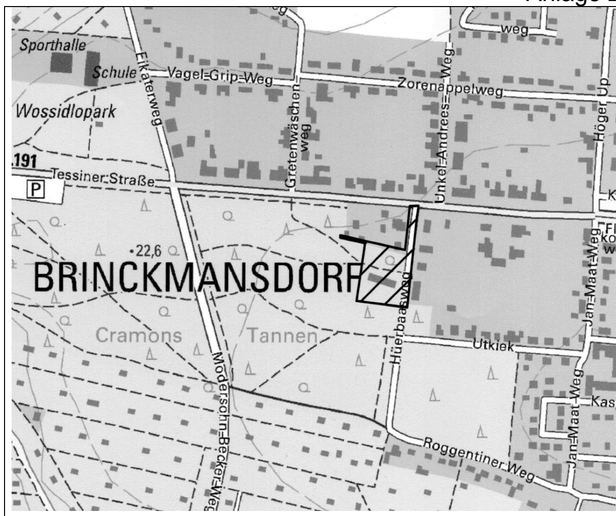
Übersichtsplan M 1: 10.000

Hansestadt Rostock Land Mecklenburg - Vorpommern