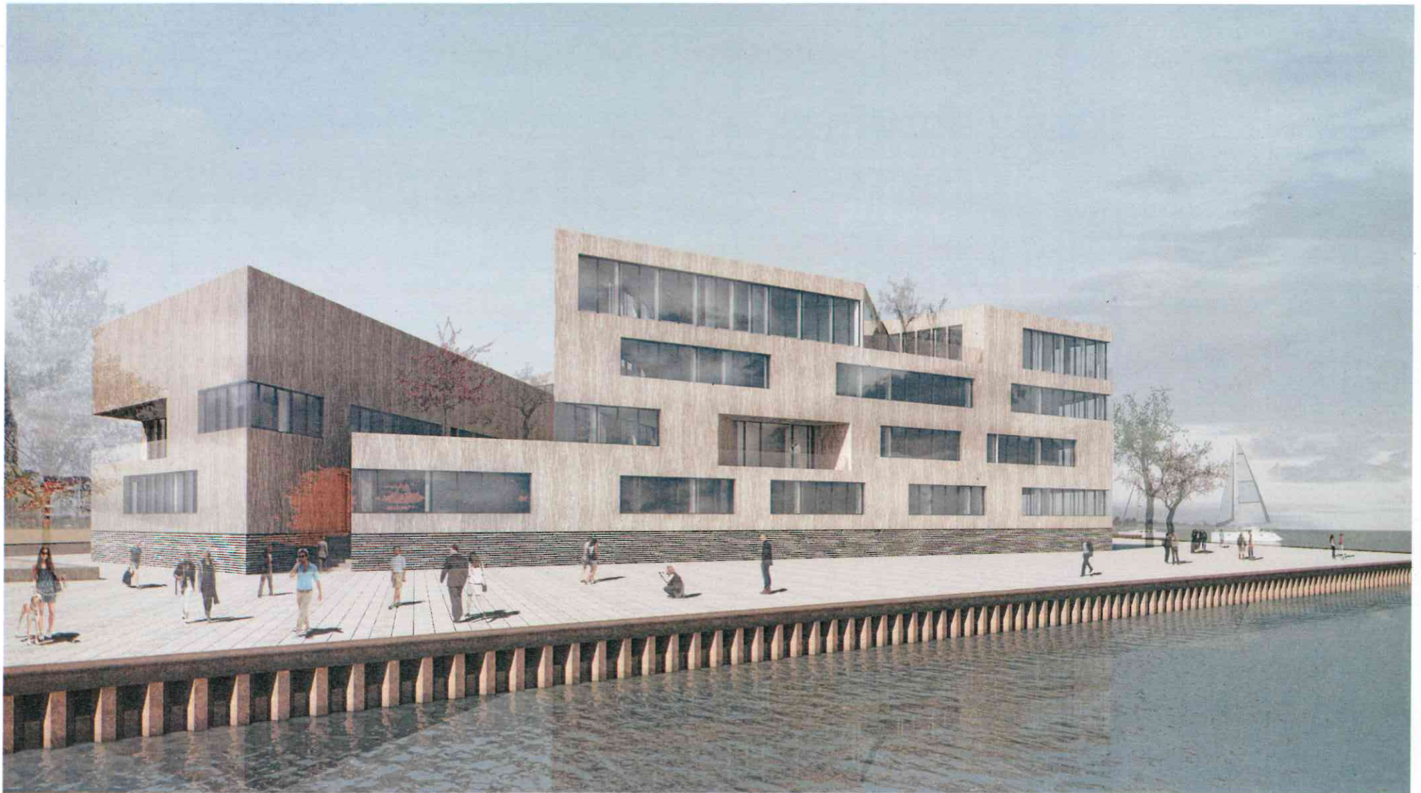
Anlage 4 Ansicht