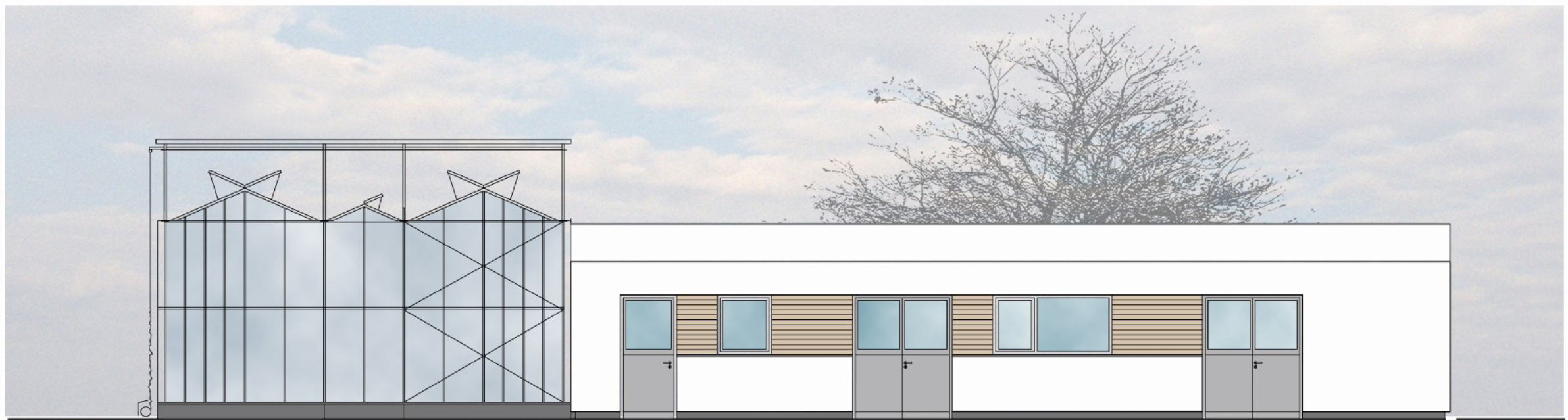
ANSICHT OST - ANLIEFERUNG