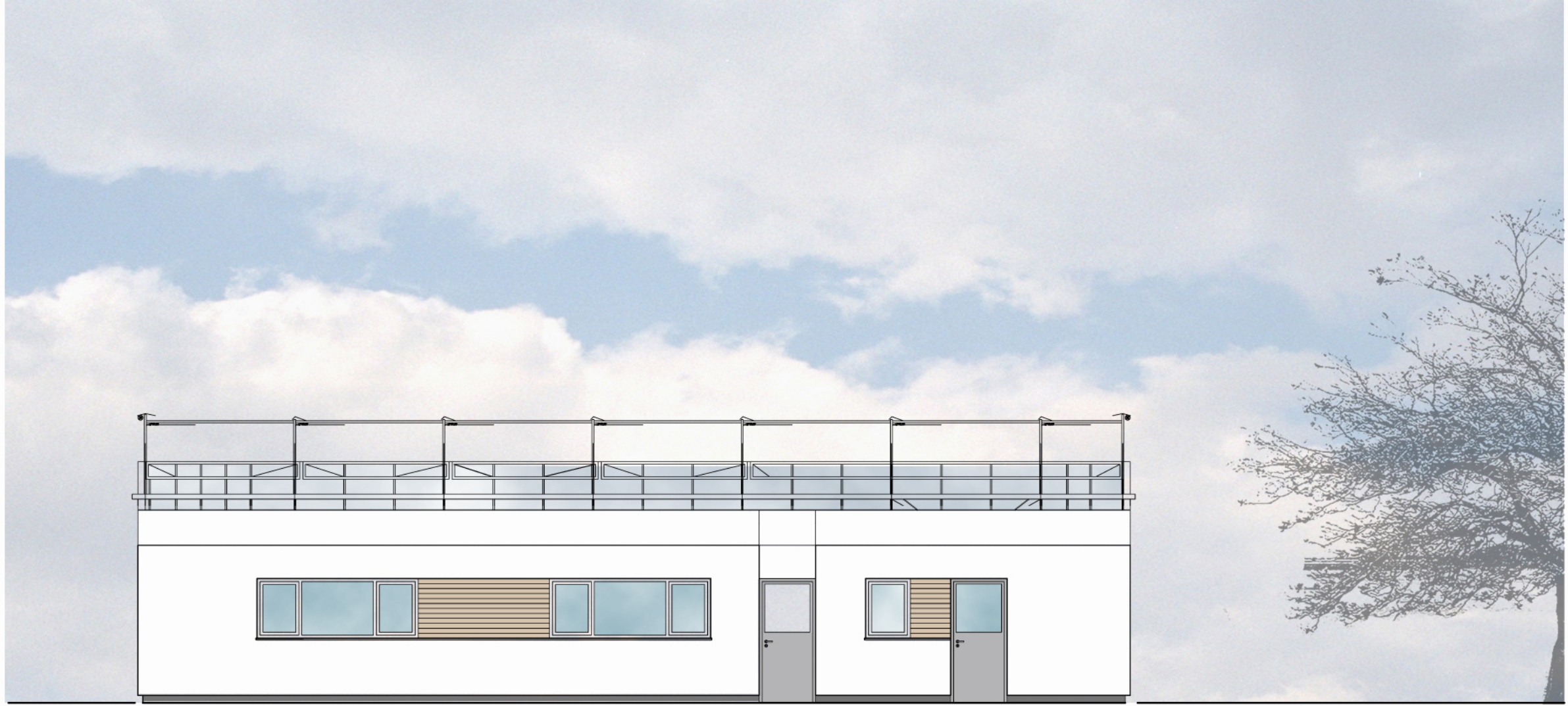
ANSICHT NORD - EINGANG