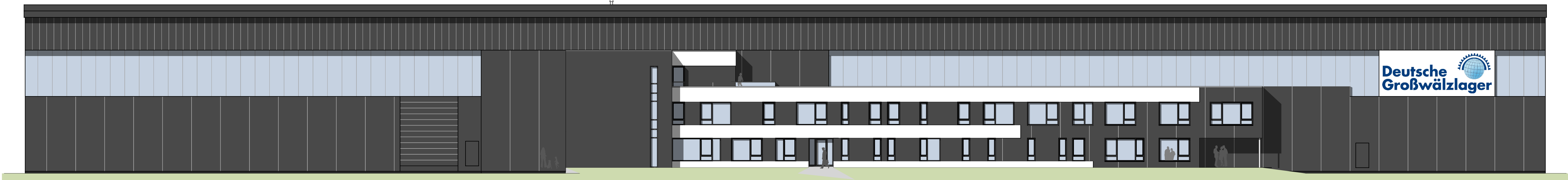
NORD - WESTANSICHT