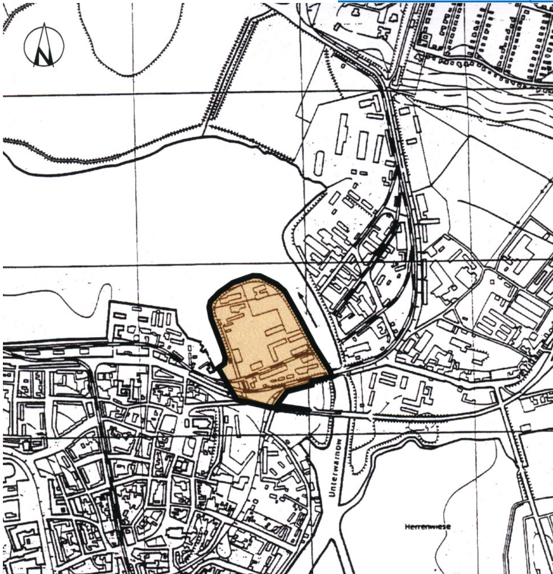
Übersichtsplan M 1: 10 000